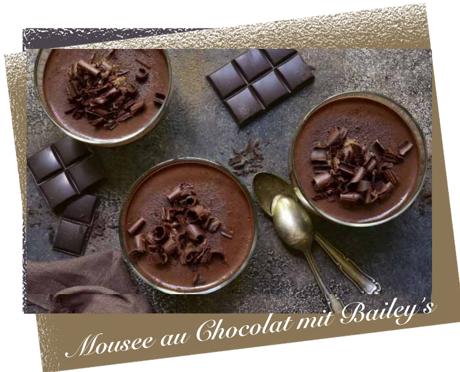
Mousse au Chocolat mit Bailey's